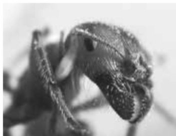
Kopf einer Ameise

Unter Menschen ist aktuell viel von partizipativen Prozessen die Rede, von Soziokratie und Sozialkompetenz, von Schwarmintelligenz, flachen Hierarchien, Sharing-Modellen. ... Mein Ameisenbüchlein (in der Reihe «Wissen» beim Verlag C.H.Beck erschienen) spricht von «Ordnung ohne Obrigkeit», verweist auf das Erbgut als hauptsächlichen Informationsträger, auf die diversen Ausprägungen der Arbeitsteilung (bis hin zu «Faulzerinnen»), die es auch bei den Ameisen gebe), und schliesslich auf die Pheromone: die Verständigung mittels chemischer Botenstoffe, die bei Gefahr oder dem Auftauchen von Beute oder sonstigen Ereignissen abgegeben werden. Chemi-